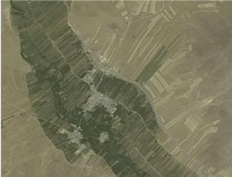
شکل ۱. نقشه هوایی روستای فش