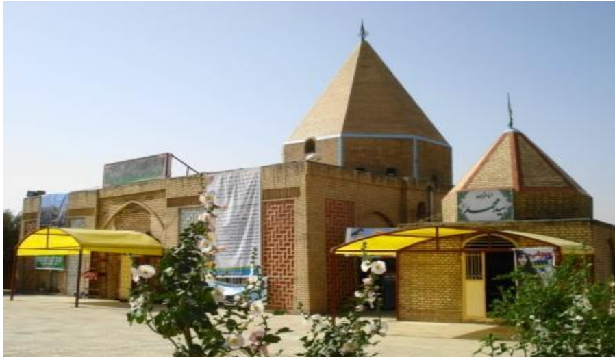
شکل ۳. زیارتگاه امامزاده سید ابراهیم (ع)