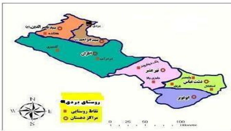
شکل ۲. موقعیت سیاسی روستای بردی نسبت به شهرستان و دهستان

تاریخچه و شجره‌نامه امامزاده سیدابراهیم (ع) به این شرح است؛ ابراهیم فرزند امام محمد باقر فرزند امام علی زین‌العابدین فرزند امام حسین فرزند امام علی فرزند ابو طالب (ع). (افشار سیستانی، ۱۳۶۶: ۲۳۷). مساحت این مکان مذهبی ۳۴۰ متر مربع است و مساحت بنای امامزاده سیدمحمد (ع) یک اتاق ۱۲ متری است. بنای اصلی دارای قدمتی ۷۰۰ ساله است و قدیمی‌ترین بنای استوار و بدون تخریب استان ایلام است (ویلبر ۱ ، ۱۳۴۶: ۱۹۵).