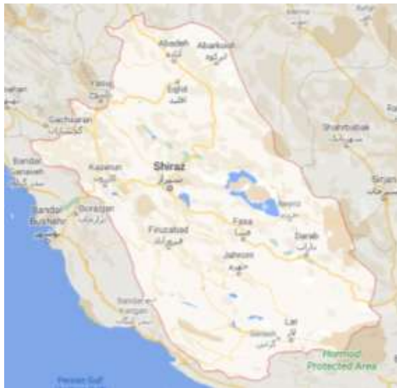
شکل ۱. موقعیت شهر شیراز در استان فارس