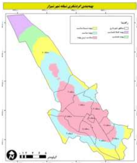
نقشه ۵. پهنه‌بندی گردشگری شبانه شهر شیراز

به بیان دیگر نظر به مراحل مختلف برنامه‌ریزی و نیز ضرورت تدقیق اولویت اقدامات در نظام برنامه‌ریزی، پهنه‌های مشخص شده به واقع به عنوان مستعدترین فضاها به عنوان استقرار وهاب گردشگری شبانه است.