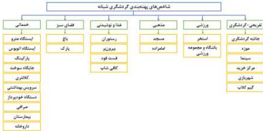
شکل ۲. شاخص‌های پهنه‌بندی گردشگری شبانه

بر اساس آنچه ذکر شد این مقاله در قالب چهار مرحله صورت گرفته است. در مرحله نخست تک تک- لایه‌ها از طریق تبدیل طول و عرض مستخرج از گوگل مپ به شیپ‌فایل ۱ تبدیل شده است (نمونه نقشه ۱). در مرحله دوم با استفاده از فاصله اقلیدسی کوتاه‌ترین فاصله بین دو نقطه برطبق رابطه فیثاغورث، محاسبه می‌شود. ابزار فاصله اقلیدوسی ۲ در بین ابزارهای توابع مختلف مجاورت محسوب می‌شود (نمونه نقشه ۲). با توجه به مقادیر خام در لایه فاصله اقلیدوسی در مرحله سوم تک تک لایه‌های می‌بایست ارزش‌گذاری مجدد شوند. یک لایه رستری با توجه به قدرت تفکیک ۳ آن از تعدادی پیکسل‌های یک اندازه تشکیل شده است که هر یک از آن‌ها دارای ارزش عددی مختص به خود هستند. به عمل همجنس کردن، طبقه‌بندی کردن یا دسته‌بندی کردن داده‌ها در یک لایه رستری طبقه‌بندی مجدد ۴ می‌گویند (نمونه نقشه ۳). در نهایت تمام لایه‌های ارزش‌گذاری شده می‌بایست در یک جمع جبری روی هم‌گذاری شوند تا لایه نهایی پهنه‌های بهینه گردشگری شبانه در شهر شیراز مشخص گردد. این امر در این مقاله توسط ابزار محاسبه سلولی یا رستری ۵ و در قالب جبر نقشه ۶ انجام شده است (نقشه ۴). نقشه‌های ۱ تا ۴ تنها به